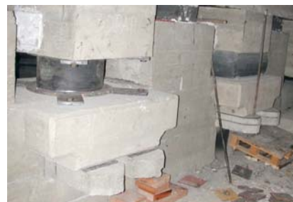
Figura 2: La scuola Johan Heinrich Pestalozzi, costruita a Skopje (Macedonia) negli anni '60 (a sinistra), vista di uno dei LDRB che costituivano sistema d'isolamento sismico originario (al centro) e vista di un nuovo HDRB appena installato nel 2007, a fianco di un LDRB non ancora sostituito (a destra).