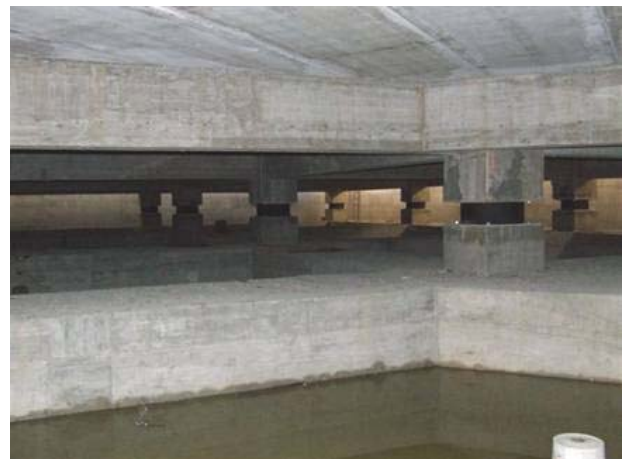
Figura 3: La nuova scuola Francesco Jovine ed il Centro Professionale ed Universitario "Le Tre Torri" di San Giuliano di Puglia, eretti su un'unica piastra isolata sismicamente, al momento dell'inaugurazione il 18 settembre 2008, e vista del sistema d'isolamento sismico durante la costruzione.

Ciò si deve alla nuova normativa sismica nazionale, sviluppata a seguito del crollo della scuola elementare Francesco Jovine di San Giuliano di Puglia, che aveva causato la morte di 27 bambini (fra i quali tutti i più piccoli) e di una maestra, durante il terremoto del Molise e della Puglia del 31 ottobre 2002. Grazie ai 61 isolatori in gomma naturale ad alto smorzamento ( High Damping Rubber Bearing o HDRB) ed ai 12 isolatori a scorrimento acciaio-teflon ( Sliding Device o SD) che la proteggono, la nuova Francesco Jovine (Figura 3), collaudata dallo scrivente e dal socio del GLIS ing. Claudio Pasquale il 2 settembre 2008 e subito dopo divenuta operativa, è giustamente da considerare "la scuola più sicura d'Italia", come è stata definita sia dal Sottosegretario dott. Guido Bertolaso, capo del Dipartimento della Protezione Civile, sia, in occasione della sua inaugurazione il 18 settembre, dal Presidente del Consiglio On. Silvio Berlusconi e dal Ministro dell'Istruzione, Università e Ricerca On Mariastella Gelmini (si veda la relazione dell'ing. Paolo Clemente).